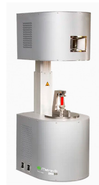
1b. ábra. Metravib DMA berendezés