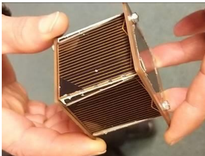
1. ábra Kézben a kész SMOG-P műhold

Ez a műhold is akárcsak az elődje méréseket végez a világűrben. Célja a tapasztalatszerzés. Feladata az elektro-szmozg mérése, azaz a Föld rádiófrekvenciás környezetének vizsgálata a 470–800 MHz-es frekvenciasávban. Az adatszerzésen kívül oktatási szerepe is nagyon fontos, hiszen oktatói segítséggel hallgatók készítették. Egy ilyen műhold egy igazi mechatronikai rendszer. Az antennanyitást kivéve, mozgó alkatrész ugyan nincsen benne, de a feljuttatás mechanikai igénybevétele és a világűri működés extrém hőmérsékleti és sugárzási körülményei igen stabil mechanikát igényelnek. Így a fejlesztő csapat nemcsak villamosmérnök hallgatókból ill. oktatókból, szakértőkből állt, hanem tudatosan gépészmérnök hallgatókat is bevontunk a berendezés-építési munkába.