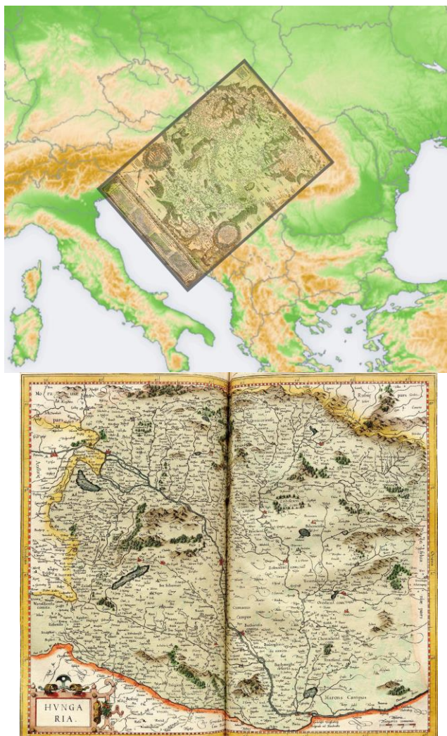
1 – 2. ábra

A BLAEU-officina saját életének megindításakor természetesen a versenytársak, a környékbeli műhelyek kiadványaira is figyelme volt, ahogy efféle kíváncsiság „dolgozott” mindig versenytársai- ban is. (Ha épp nem az átvehető-„eladható” térképi tartalmuk miatt, legalább a drága rézlemezek meg- vásárlására, majdani újra-felhasználhatóságára gondolva.) Így vették meg a XVI. sz. végén a híres Gerhard CREMER (MERCATOR) hagyatékát is, benne egy olyan HUNGARIA- térkép lemezével, való- színűleg 1596-ból, melynek az orientációja követte LAZIUS és LÁZÁR deák térképét. Így onnantól a világtengerektől távol azt a 45 fokkal döntött tájolást, az ő ábrázolási módjukat örökítették, térkép- szerkesztőként, kiadóként ők is tovább.