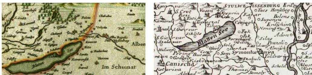
8 A + 8 B ábra

Megint újabb évek következnek még addig, hogy Joan van der BRUGGEN egy újabb térképén, a Regnum Hungariae 1737 címűn úgy mutatta be a Drávától és folytatólagosan a Duna alsó szakaszától É-ra levő térséget, hogy Orsovától ÉK felé az ábrázolt terület K-i széle kis kanyarral húzódott tovább É-ra, és így Gyulafehérvártól K-re Szecsel, majd onnan É-ra Medgyes, tovább pedig Radnót és Beszterce még rajta voltak. E „mappa” Ny-i felének közepe táján pedig Blatten See-nek írva látszik a tó, É-ról benyúló, Tihanyt is tartalmazó félszigettel – és onnantól már mind „ismerősök” voltak a Balaton-térképek.