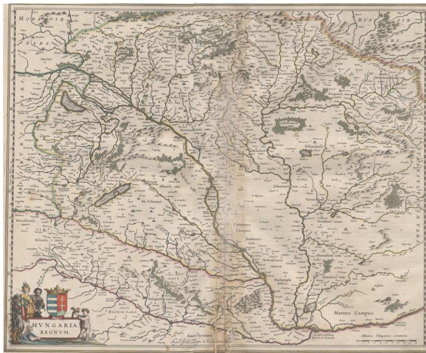
3. A, 3. B, 3. C ábra Hungaria (1635-38), ismertető oldalak (A, B), köztük a térkép (C).