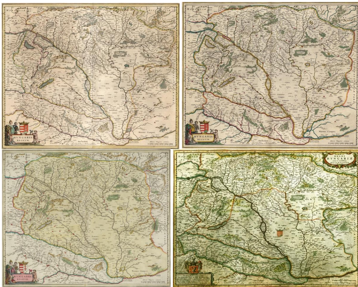
4 A, 4 B, 4 C, 4 D ábra

A folytatás elől ezután már nem térhetett ki a BLAUE-kiadó – és nem is volt célja, hiszen európai elsőségét csak így tarthatta meg – így amelyik lap később került atlaszba, az már még frissebb adatokat adott át, őrzött meg. Így készültek a Regnum Hungaria-térkép frissebb oldalai is (ld. alább, szöveg nélkül).