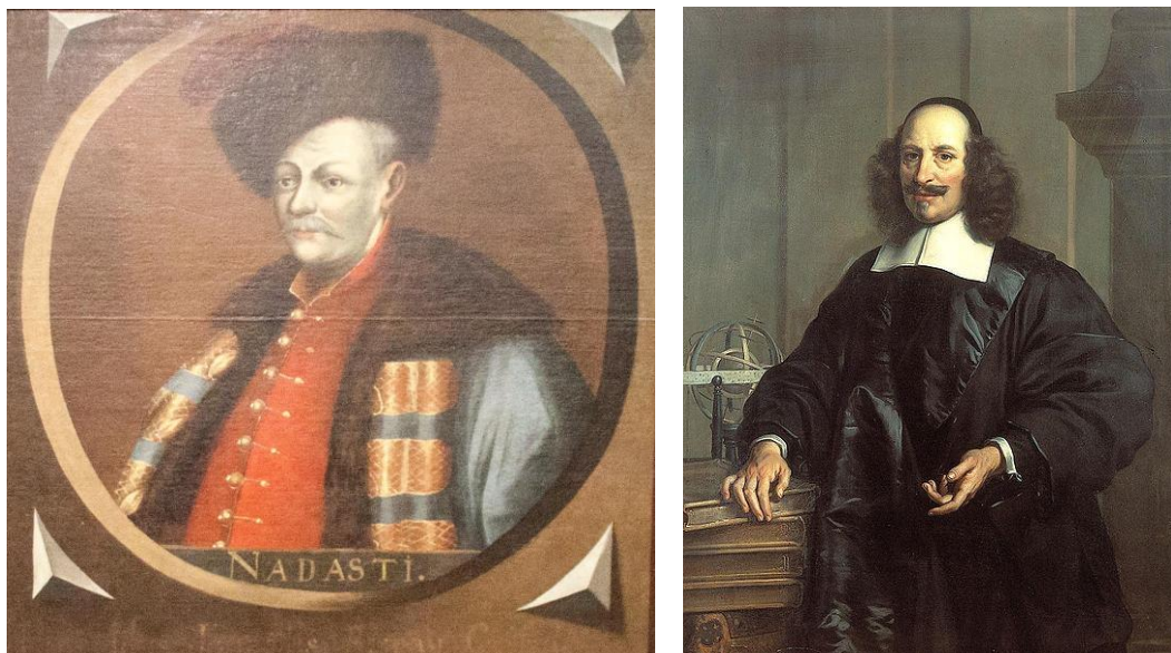
5 + 6. ábra

NÁDASY III. Ferenc gróf (1623-1671) (5) – és Johan BLAEU (1596?-1673) (6)