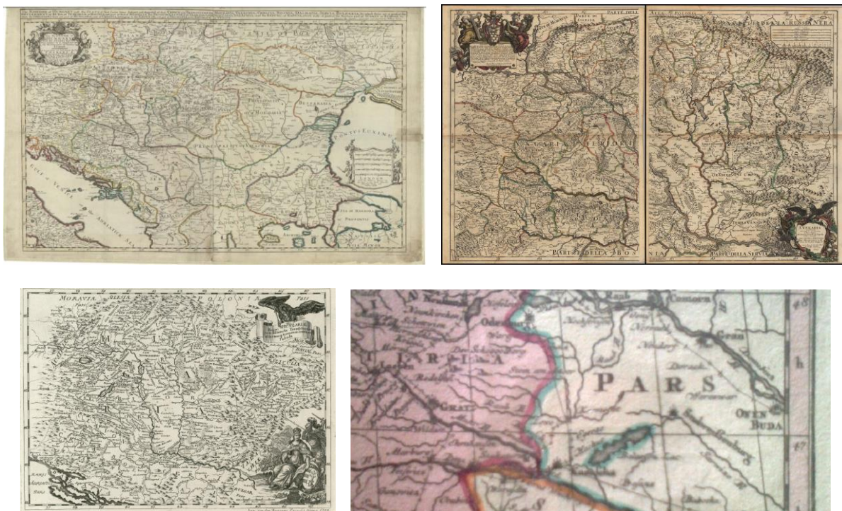
7 A – 7 B – 7 C – 7 D ábra

A nagyszerű atlasz-, glóbuszkészítés és -kiadás azonban már nem volt újraindítható. A térképész és nyomdász, a világhírű BLAEU-officina megindítójának a fia, a fáradhatatlan és sikeres mesterember-művészember bele is rokkant ebbe, a következő év májusában meghalt.