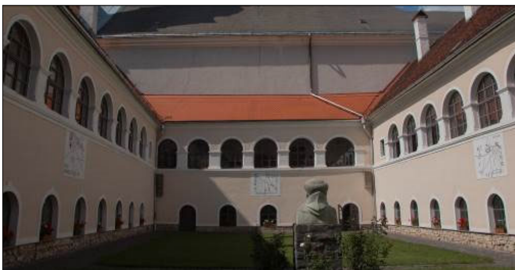
6. ábra. Csíksomlyó, Ferences kolostor, 1779.

A legtöbb erdélyi napóra templomokon, esetleg más középületeken található. Elsősorban katolikus templomok falán, illetve katolikusból később protestáns vallásúvá lett templomokon. Ortodox templomon általában akkor találunk napórát, ha a templom katolikus vagy evangélikus volt régebben, majd valamilyen módon ortodox templom lett, és a napóra megmaradt (Dipse, Beszterce "Korona", Újradna). Nemzetiségekre lebontva ez úgy néz ki, hogy a magyarok és a szászok készítettek, használtak napórákat, a majdnem egyáltalán. A szászok által készített napórák helyesen vannak megszerkesztve, a magyarok által készítették nem mindig. A legpontosabbak a ferences kolostorokban (6. ábra) és a szász iskolákban találhatóak. A legtöbb katolikus templomon helyesen áll az árnyékvető (Hargita megye), a református vagy unitárius templomokon kevésbé pontosak. Vannak kivételek is. Ami aggasztó, az az, hogy a mostanság felújított templomoknál a napórákat nem szakértelemmel újították fel (Szászrégen, Beszterce "Korona" templom, Székelyudvarhely Tanítóképző, Székelyderzs, Magyargyerőmonostor, Kalotaszentkirály), emiatt pontatlanok.