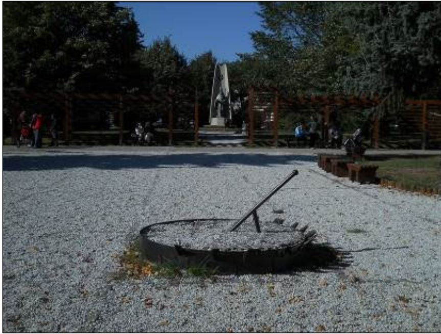
1. ábra. Gyergyószentmiklós, központi park, 2015.