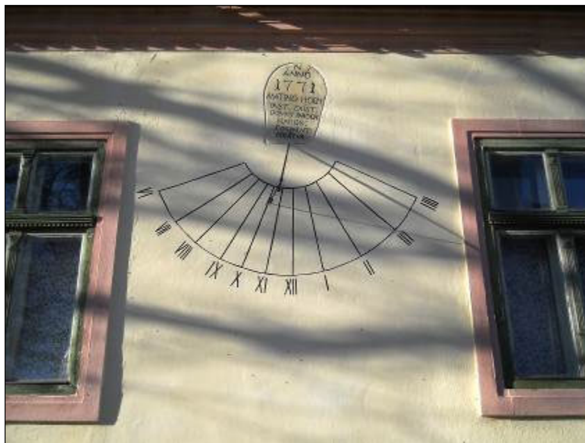
3. ábra. Szásznádas (Maros megye), Evangélikus plébánia, 1771.

Ezen kívül van még egy általános szabályosság, amit igen könnyű ellenőrizni egy napórán. Mivel a Nap 24 óra alatt 360^\circ -os szögben járja körbe (látszólagosan) a Földet, akkor 12 óra alatt 180^\circ -os szöget tesz meg. Ez a napórán úgy jelenik meg, hogy a reggeli 6-os és a délutáni 6-os (vagy reggeli és délutáni 5-ös, 7-es vagy 8-as) óravonalak között 180^\circ -os a szög, azaz folytatólagosan egy egyenesen vannak (Székelyderzs, Kovászna, Szászszőlős, Szilágynagyfalva). Ha nincs így, a napóra nem lehet pontos (Gyulafehérvár Teológia, Brassó Lutheránus templom, Szamosújvár örmény templom, Újtorda, Kézdiszentlélek, Alfalu magánház, Bögöz, Nagyalambfalva, Csíkszentdomokos, Héjjasfalva, Buziásfürdő, Kalotaszentkirály, Karcfalva, Beszterce Korona templom, Gyergyószentmiklós templom).