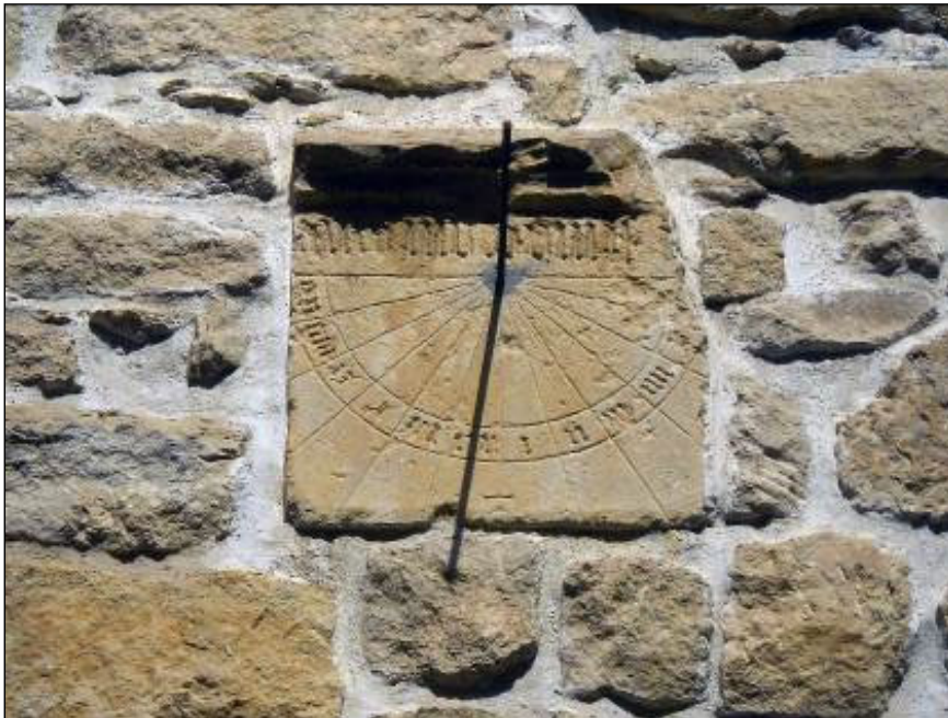
2. ábra. Kolozsmonostor, Kálvária templom, 1449.

Abból kiindulva, hogy a helyesen beállított gnómon mindig pontosan észak felé mutat, következik, hogy deleléskor az árnyéka pontosan észak felé áll (az északi féltekén). A vízszintes napóránál ez azt jelenti, hogy a déli 12 óra vonala pontosan észak felé mutat, a függőleges napóránál pedig azt, hogy a déli 12 óra vonala mindig pontosan függőlegesen lefelé mutat, bármerre is áll a függőleges fal (Kolozsmonostor – 2. ábra).