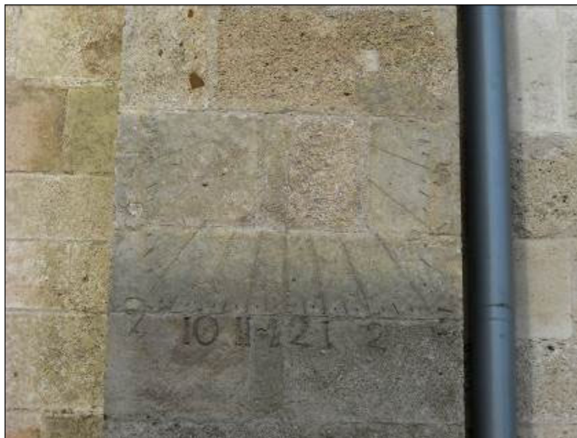
4. ábra. Gyulafehérvár, Székesegyház

(Fiatfalva, Héjjasfalva). Ha tehát a napórán a 6–6 óravonal vízszintes, de a falnak van deklinációja (keleti vagy nyugati), akkor a napóra nem lehet pontos (Gyulafehérvár Székesegyház – 4. ábra, Tövis, Kürtös, Kolozsmonostor, Kolozsvár Wolphard-ház, Kolozsvár Pávai-ház, Bánffyhunyard, Vajnafalva, Székelyderzs).