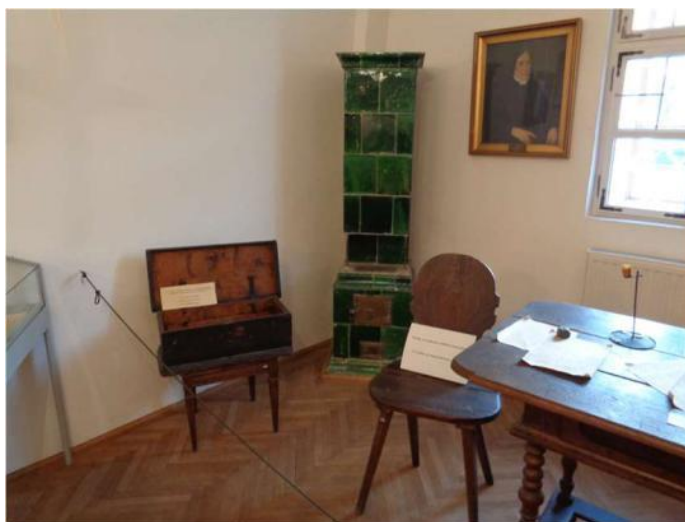
Biblioteca Teleki–Bolyai, Muzeul Bolyai

În Muzeul Bolyai pot fi văzute relicve precum cufărul lui Farkas Bolyai cu care a plecat ca elev, având șase ani și jumătate, trimis de părinții săi să studieze la colegiul din Aiud. Aici pot fi admirate și primele sale picturi în ulei, precum și ceașca de lemn în care colecta cenușa când distrugea colile cu versurile sale. Vizitatorul poate observa că, deși există o vitrină separată pentru János Bolyai, Farkas are mult mai multe relicve în muzeu decât János. Motivul este că, din păcate, din partea lui János nu au rămas prea multe relicve, bunurile sale fiind vândute la licitație sau risipite după moartea sa. Din fericire, o mare parte din manuscrisele sale a supraviețuit.