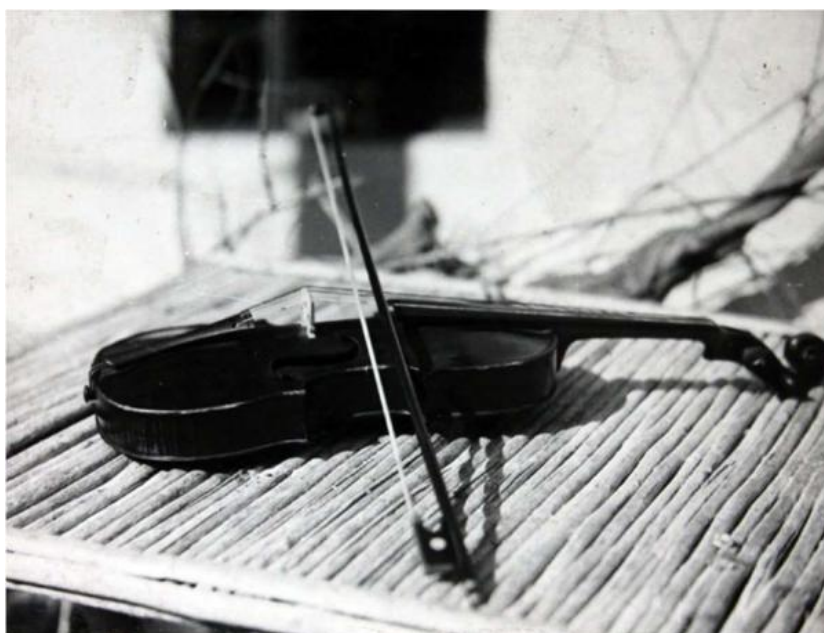
Fotografia vioarei lui János Bolyai (?)

La Biblioteca Teleki-Bolyai din Târgu Mureș există o fotografie care de obicei este prezentată ca înfățișând vioara lui János Bolyai. Am avut privilegiul să primesc o copie a acestei fotografii de la colegii de la Biblioteca Teleki-Bolyai și să o studiez mai îndeaproape. În același timp am găsit o altă sursă importantă. După cum știm, Târgu Mureșul nu este singurul centru al cercetărilor legate de Bolyai. Astfel de activități au loc și la Budapesta. Biblioteca Manuscriselor Academiei Maghiare de Științe găzduiește o colecție valoroasă de materiale Bolyai, inclusiv ceea ce se numește „colecția Hints”.