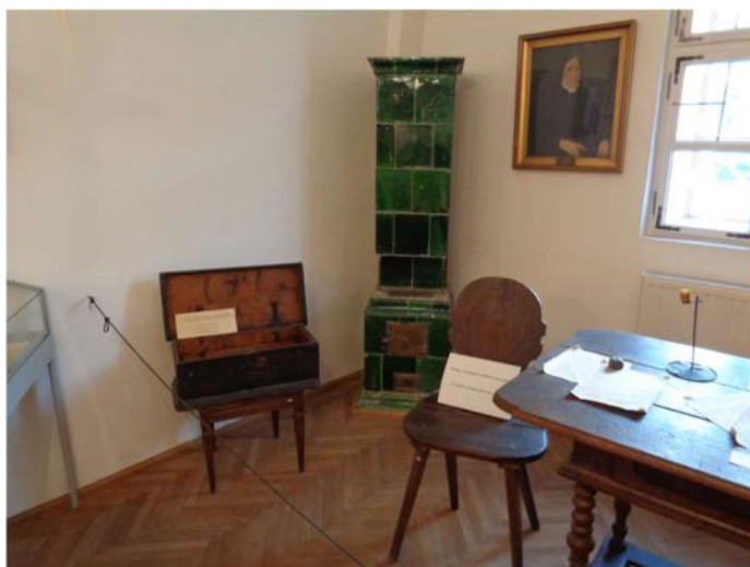
Biblioteca Teleki–Bolyai, Muzeul Bolyai

În Muzeul Bolyai pot fi văzute relicve precum cufărul lui Farkas Bolyai cu care a plecat ca elev, având șase ani și jumătate, trimis de părinții săi să studieze la colegiul din Aiud. Aici pot fi admirate și primele sale picturi în ulei, precum și ceașca de lemn în care colecta cenușa când distrugea colile cu versurile sale. Vizitatorul poate observa că, deși există o vitrină separată pentru János Bolyai, Farkas are mult mai multe relicve în muzeu decât János. Motivul este că, din păcate, din partea lui János nu au rămas prea multe relicve, bunurile sale fiind vândute la licitație sau risipite după moartea sa. Din fericire, o mare parte din manuscrisele sale a supraviețuit.