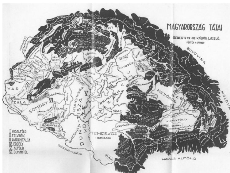
2. ábra Magyarország tájai (1941)

Legfigyelemreméltóbb közülük PRINZ GYULA „Magyarország tájrajza” (1937), „A magyar tájak rendszeres szemlélete” c. fejezete (263-341 o.) [11], amelyben hazai tájnévadásunk számos kérdését fölveti, s megkísérli az azonos tájra, tájegységre vonatkozó különböző nevek közül – alapos „körüljárás” után – a legmegfelelőbbeket kiválasztani. Térségünket 15 tájra tagolja (1. ábra). Hasonlóan érdekes és számos tájnévvel kapcsolatos kérdést is megtárgyal Kádár László [12], amelyet alapos nagyon részletes térképpel zár le (2. ábra).