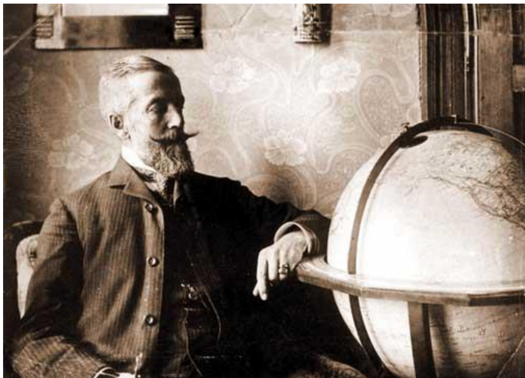
Kogutowicz Manó (1851–1908)