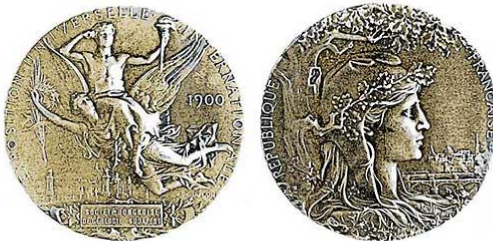
1900-ban megrendezett párizsi világkiállítás aranyérme

Kogutowicz Manó jól ismerte az akkori nyomdatechnikai lehetőségeket. 1885-ben ő készítette el Magyarország első megyei kézi atlaszát. 1896-ban kezdte el a földgömbök gyártását, mely kétféle nagyságban készült el (25,5 cm és 51 cm átmérőjű), a nagyobbik földgömböt teljes felszereléssel is ellátta (fokbeosztás, állatövi jegyek rajzai, hónapok nevei és azok napjainak beosztása, valamint az állvány talpába iránytűt is építettek be). Cholnoky Jenő a glóbusz-gyakorlati foglalkozásokra „A Föld-globus és annak használás-módja különös tekintettel a Magyar Földrajzi Intézet R-T. gyártotta glóbusokra” címmel írt jegyzetet. Kiváló minőségben készültek el a földgömbök, a külföldi kereslet hatására német, olasz és szlovén névrajzú glóbuszokat is gyártottak. Ez volt az intézet fejlődésének csúcspontja, a párizsi világkiállításon 1900-ban magas kitüntetéssel, aranyéremmel ismerték el kiváló térképeit [3.].