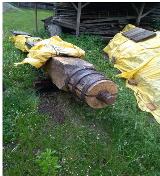
4. ábra Elkészült a bütykös tengely