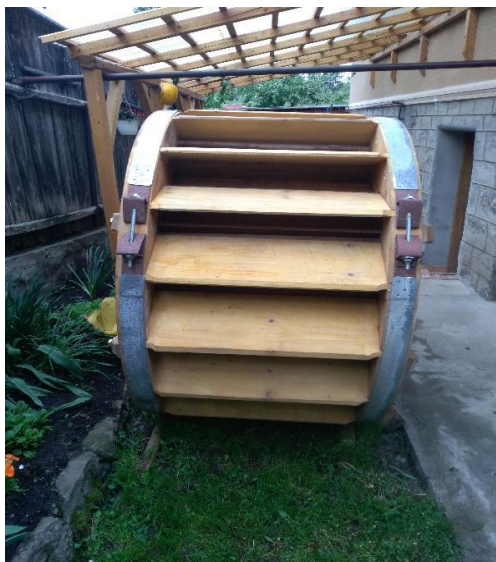
3. ábra Az új vízi kerék