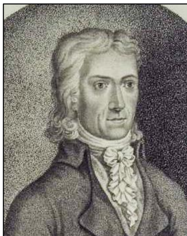
1. ábra. August Batsch arcképe.

Az ásványtant az alsóbbrendű állatok után tárgyalja összefoglaló tankönyve 2. kötetében [1]. Egy figyelemre méltó fizikai-kémiai bevezető után az egyes ásványfajokat a korban szokásos négy osztatú rendszerben ismerteti (1. földek és kövek, 2. fémek és ércek, 3. sók, 4. éghető ásványok). Az ősmaradványokat az állattan és a földtörténet érdeklődési körébe utalja, az ásványokból összesült kőzetek ( zusammengebäcknen Steine ) rendszerezésével nem foglalkozik.