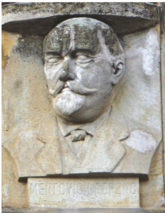
2. ábra Mentovich Ferenc (1819–1879) a Marosvásárhelyi Kultúrpalota féldomborművén

Előadásom befejező részben Arany Jánosról szeretnék néhány szót szólni, megemlékezve a 2023. június 1-én elhunyt Dánielisz Endréről.