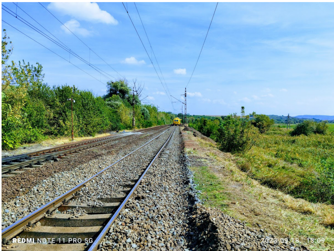
3. ábra Biatorbágy - Herceghalom bal vágány ágyazatrostálás elindulása