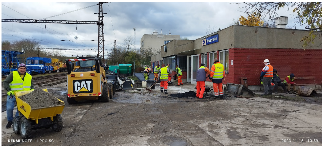
4. ábra Herceghalom felvételi épület előtti tér rekonstrukciója