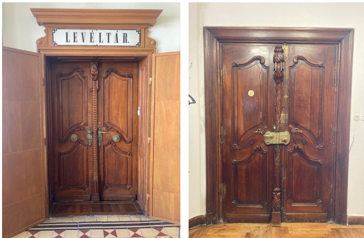
2. ábra. A Levéltár kétszárnyú ajtajának külső és belső nézete

A két szárnyat záró középső takaróléc az ajtó legszebb részleteit hordozza, amelyek copf stílusú faragványok. Külső oldalát visszafogottabb, sávosan közrefogott, pikkelyszerű motívummal és összetett talapzattal alakították ki. Szokatlan a takaróléc ilyen nagyvonalú, széles kialakítása. Maga a talapzat is a kannelúrákkal, valamint az oldalán csigavonalba kanyarodó geometrikus mintájával már egy modernebb megjelenést mutat. A külső takaróléc fejezete ugyancsak klasszicizáló barokk ízű a kétoldalt lelógó drapériával és rozettával. A belső oldalon a középső takarás kialakítása szobrászati minőségű; a levéldíszek, a fonatok és a páлмаfejezet délies hangulatot áraszt.