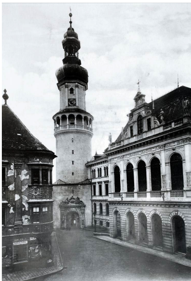
1. ábra. Az új eklektikus városháza 1918-ban (a kép jobb oldalán) [4]

átépítése is szóba került. A korábbi barokk Fő tér harmonikus egységét az új városháza a túlzott léptékével jelentősen megbontotta.