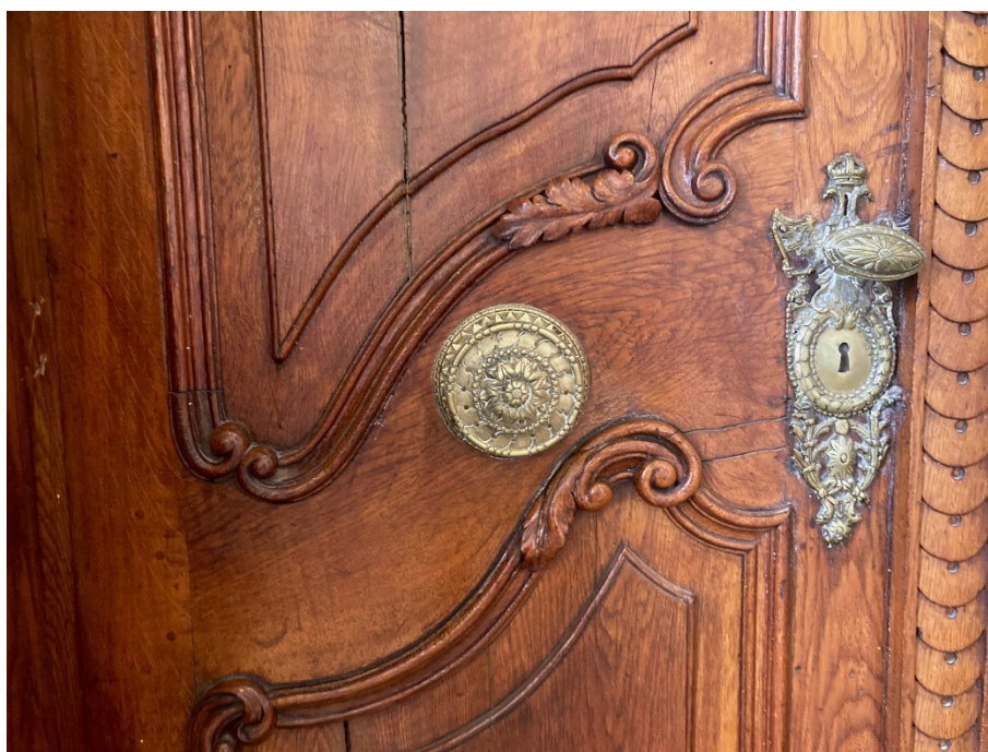
4. ábra. A külső oldali ajtóhúzó és a zárcímke