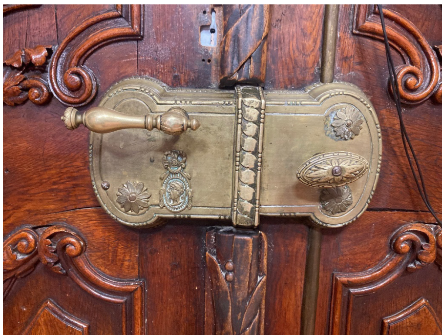
3. ábra. A levéltári ajtó doboz zárja

biztonságot egy modern zárszerkezet garantálja. A modern nyitó- és zárszerkezet elhelyezése, valamint vezetékezése azonban nem illeszkedik méltó módon a műemléki értékű nyílászárhoz.