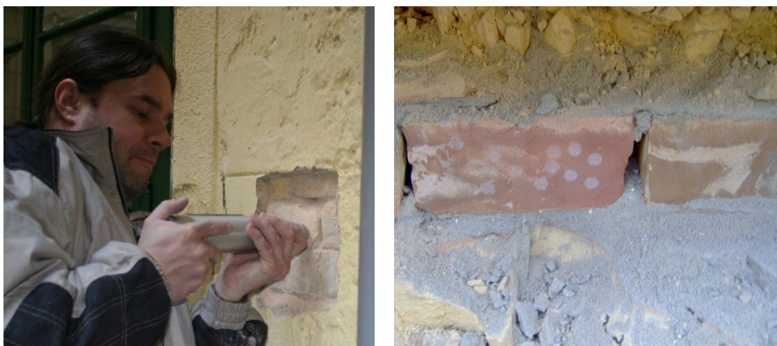
7. ábra: Schmidt-kalapáccsos vizsgálat és a vizsgálat nyoma nagyméretű tömör téglán

Az egyik legelterjedtebb módszer a felületi keménység vizsgálata, amelyet leggyakrabban Schmidt-kalapáccsal végzünk. A mérés során a visszapattnási érték alapján következtetnek az anyag felületi keménységére és nyomószilárdságára. Bár a módszer gyors és egyszerű, alkalmazása során figyelembe kell venni, hogy az eredmények erősen függenek a felület állapotától (érdesség, degradáció), az anyag heterogenitásától és a nedvességtartalomtól. Emiatt a kapott értékek elsősorban összehasonlító jellegűek és empirikus összefüggések segítségével értelmezhetők [14].