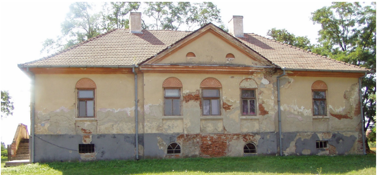
3. ábra Példa egy történeti homlokzat nedvesedésére és a jól látható sókivirágzási folyamatokra