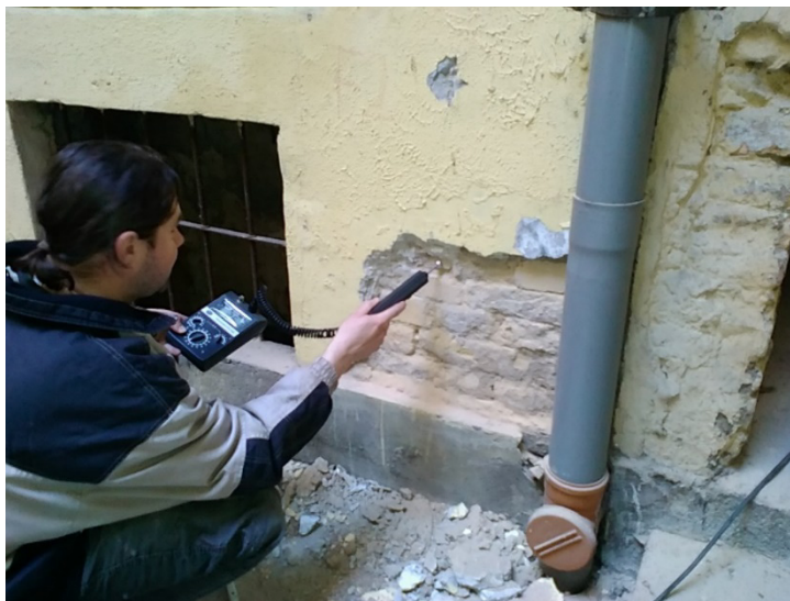
6. ábra: Roncsolásmentes nedvességmérés

Összességében megállapítható, hogy a történeti tégl- és kőfalazatok nedvességvizsgálata komplex, több módszert integráló folyamat. A megbízható állapotértékelés csak különböző vizsgálati eljárások kombinált alkalmazásával érhető el, amely figyelembe veszi a szerkezet anyagi sajátosságait és a környezeti hatásokat. Ez a megközelítés alapvető feltétele a műemléki értékek hosszú távú megőrzésének.