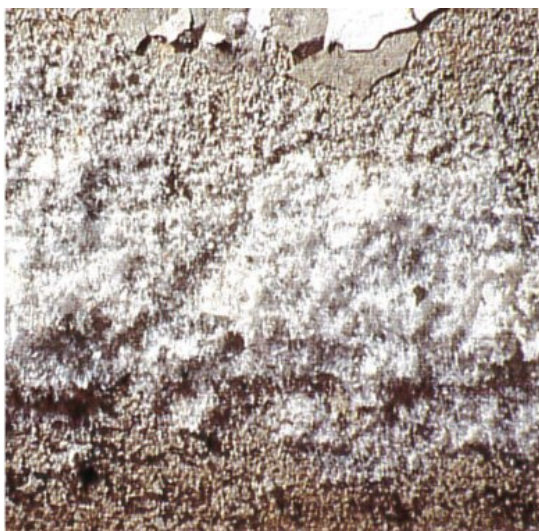
5. ábra Példa egy történeti pincefalazaton tapasztalt szulfátos sókivirágzásra

A roncsolásos vizsgálati módszerek közé tartozik a mintavétel és a gravimetriás nedvességtartalom-meghatározás (Darr-módszer), amely a legmegbízhatóbb mérésnek tekinthető a felsorolt eljárások közül. Ennek során a falazatból vett (vésett darabos vagy fűrt por állapotú) minták tömegének szárítás előtti és utáni különbségéből határozható meg a tényleges nedvességtartalom. A módszer nagy pontosságot biztosít, azonban lokális jellegű és a mintavétel a szerkezet károsításával jár, ezért alkalmazása általában korlátozott.