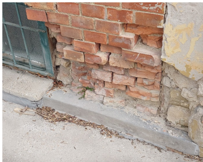
4. ábra Példa egy történeti homlokzat lábazati részének fagykárosodására

A sók kristályosodása során fellépő térfogatváltozás jelentős feszültségeket generál (4. ábra), amely a falazat fizikai mállásához vezet. A fagyás tovább súlyosbítja a károsodást.