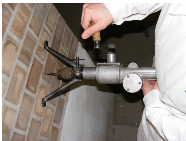
8. ábra: Habarcsvizsgálat próbafúrással vizsgálati helyszínen és laboratóriumban

Összességében a roncsolásmentes vizsgálatok nélkülözhetetlen eszközt jelentenek a történeti falazatok diagnosztikájában. Bár önmagukban gyakran nem adnak teljes képet, más vizsgálati módszerekkel kombinálva megbízható alapot biztosítanak az állapotértékeléshez és a szükséges beavatkozások megtervezéséhez.