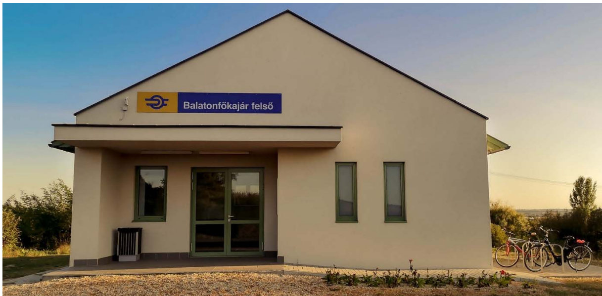
6. ábra ... és a felújítás után 2021-ben