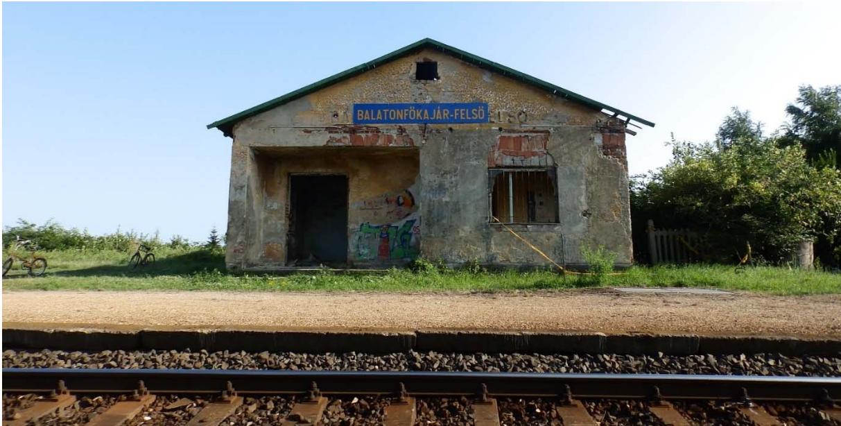
5. ábra Baaltonfőkajár-felső felvételi épület 2014-ben

A korábbi (1990-2000-es évek) rossz hagyományi utána vonal fejlesztése során meglepő módon sok régi felvételi épület lett megmentev, helyreállítva. Ezzel is növelve, illetve megőrizve az üdülőterület vonzerejét.